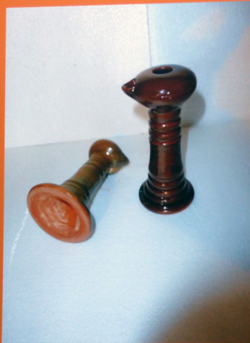
8-Lucerne con e senza ingobbio