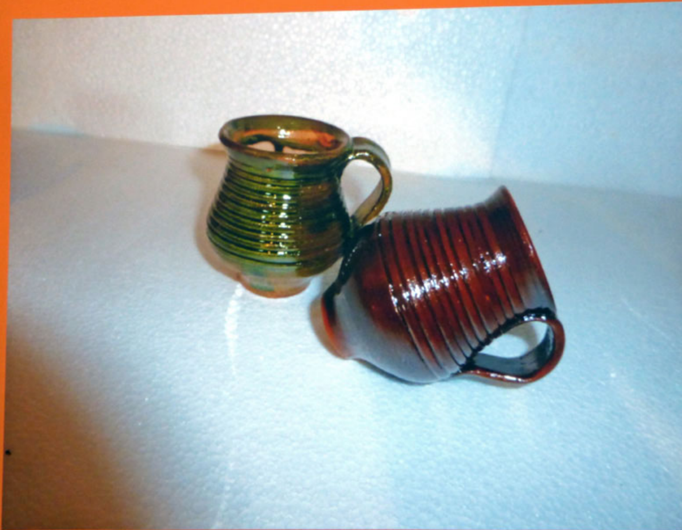
11-Bicchieri con e senza ingobbio