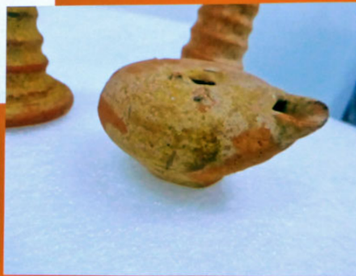
15-lucerna con probabile ingobbiatura