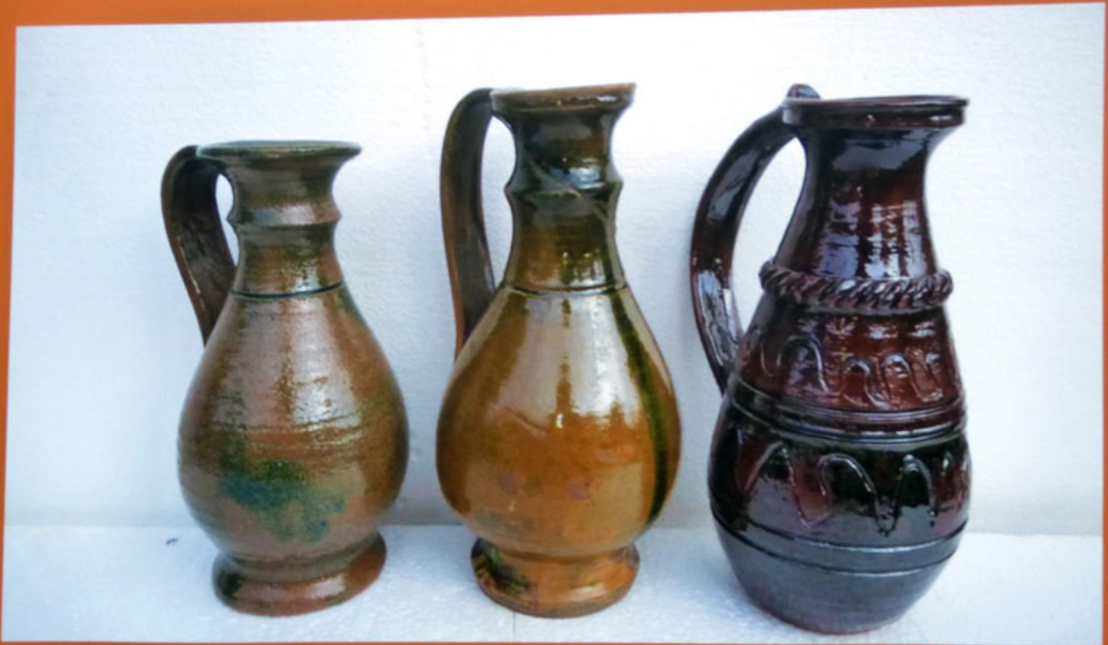
6-olpi nelle differenti tecnologie