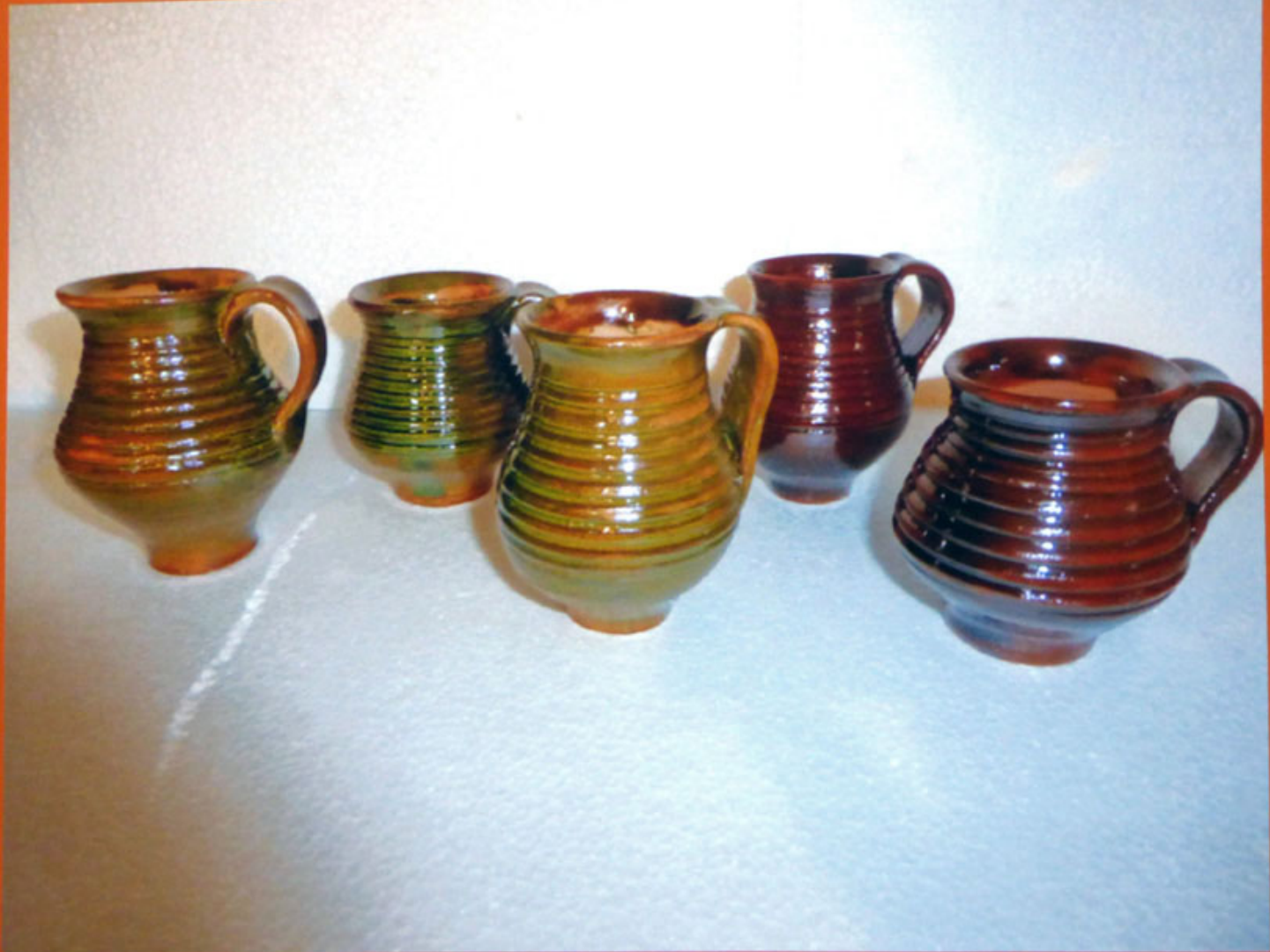
12-Bicchieri vari con e senza ingobbio