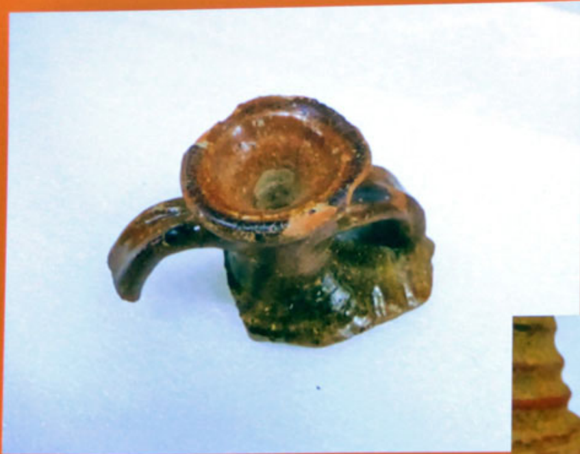
14-frammento di piccola anfora con probabile ingobbiatura